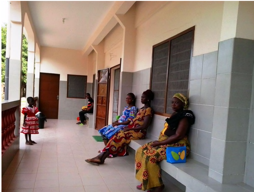
Eingang zur Krankenstation mit Wartebereich

Der erforderliche Betrag für die zusätzlichen Maßnahmen belief sich auf 13.250 Euro. Inzwischen ist das Projekt fertig gestellt, die Abrechnung liegt uns vor und ist geprüft. Unsere Mittel wurden zweckbestimmt entsprechend der Antragstellung verwendet.