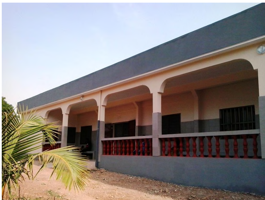
Der Erweiterungsbau ist fertig gestellt

2016 wurde dort ein Erweiterungsbau erstellt, der durch Spender in Polen finanziert wurde. Die Klinik benötigte weitere finanzielle Unterstützung durch das FKB, da die Mittel nicht ausreichten. Darüber hinaus waren viele zusätzliche Arbeiten notwendig, für die das Geld fehlte: Ausrüstung für die neuen Gebäude und die Apotheke, Malerarbeiten und zusätzliche Reparaturen am alten Gebäude, welches durch eine Überdachung mit dem neuen Gebäude verbunden werden sollte.