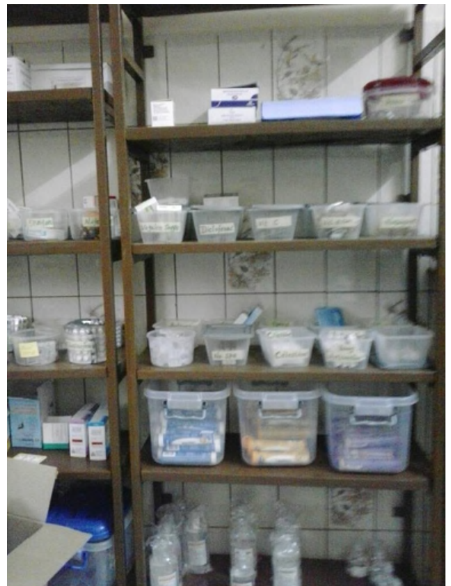
Medikamentenvorräte der Krankenstation und der Apotheke