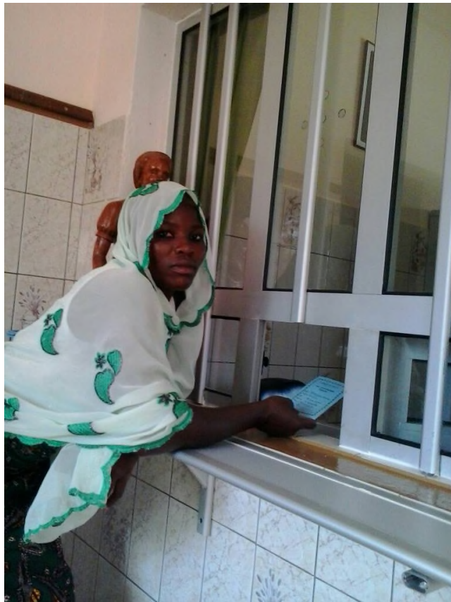
Patientin am Medikamenten- und Apothekenschalter