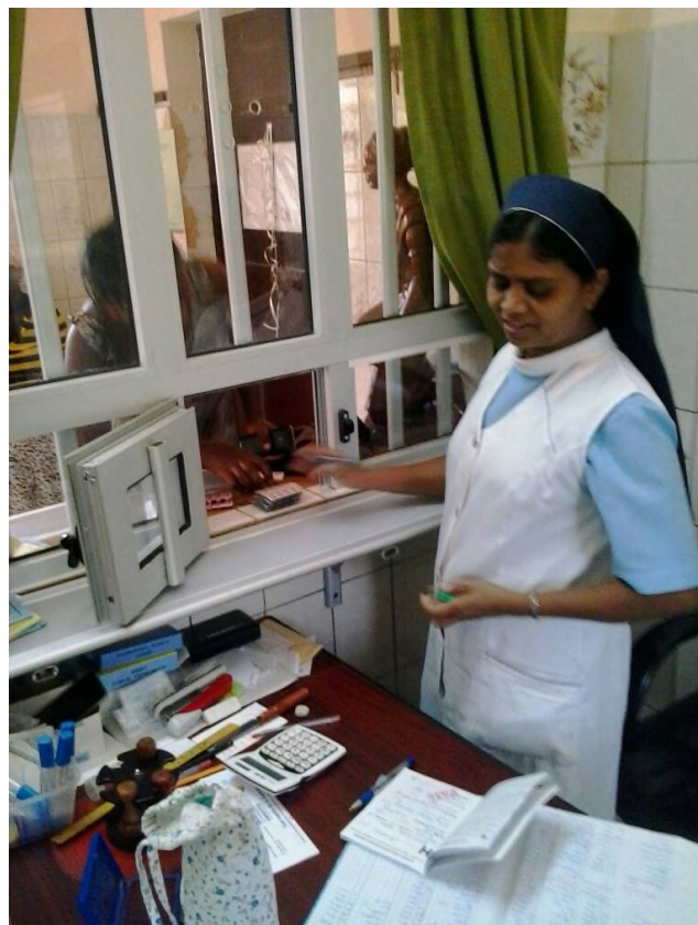
Medikamentenausgabe am Apothekenschalter

Bei der nächsten Togoreise der FKB-Vertreter, wird unter anderen auch die Mutter-Kind-Klinik in Bassar besucht. Vor Ort werden wir uns über die Investitionen, die Arbeit, Fortschritte und die Qualitätsverbesserung des Patientenservice der Steyler Schwestern informieren.