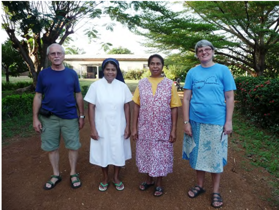
2014 bei den Steyler Schwestern der Klinik in Bassar, Togo

Das Zentrum wird seit fast 25 Jahren von Missionsschwestern betreut. In den ersten Jahren hat sich das Gesundheitszentrum auf die Fürsorge für Mütter und Kinder konzentriert: pränatale und postnatale Betreuung, der Schutz von Kindern vor übertragbaren Krankheiten durch ein regelmäßiges Impfprogramm, die Sorge um unterernährte Kinder, Ernährungsberatung und Hilfe bei der Kinderbetreuung.