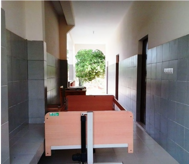
Flur zu den Krankenzimmern