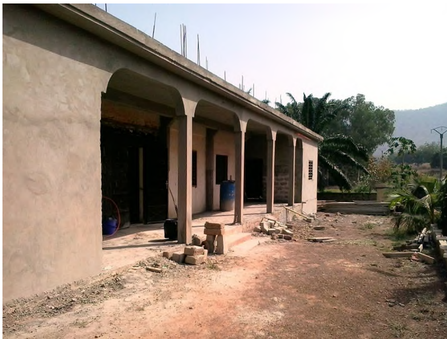
Der Erweiterungsbau im Rohbau

2016 profitierten ungefähr 2.313 Patienten von der Heilbehandlung, 254 Mütter von der Schwangerenbetreuung und 2.326 Patienten von Labor-dienstleistungen. 2017 nahmen noch mehr Patienten die Klinik in Anspruch.